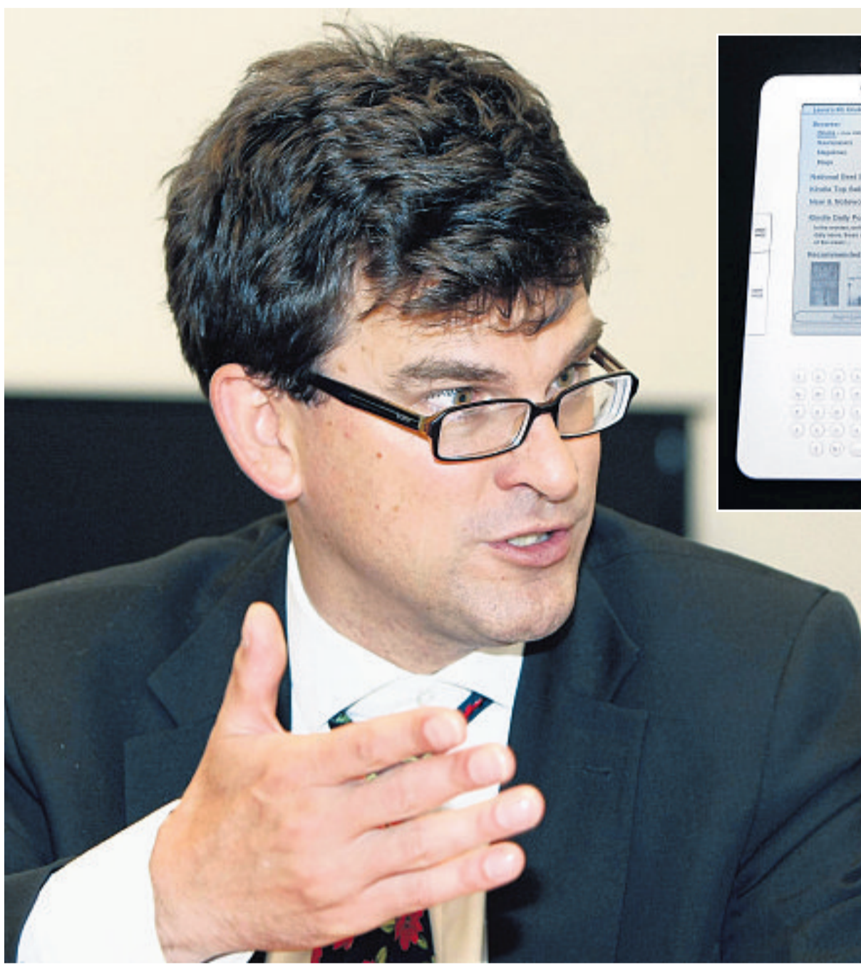
Héctor Fabio Zamora / EL TIEMPO

Creo que para que exista una sociedad letrada los libros deben ser accesibles a todos, deben estar en todas partes, no solo en librerías, y también a la mano, en términos de precios. Muchos pequeños libreros murieron porque los grandes no los dejaron sobrevivir. Las pequeñas editoriales tienen que poder competir con grandes librerías y ahí es