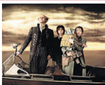
‘Lemony Snicket, una serie de eventos desafortunados’, Canal Fox, 6:00 p.m.